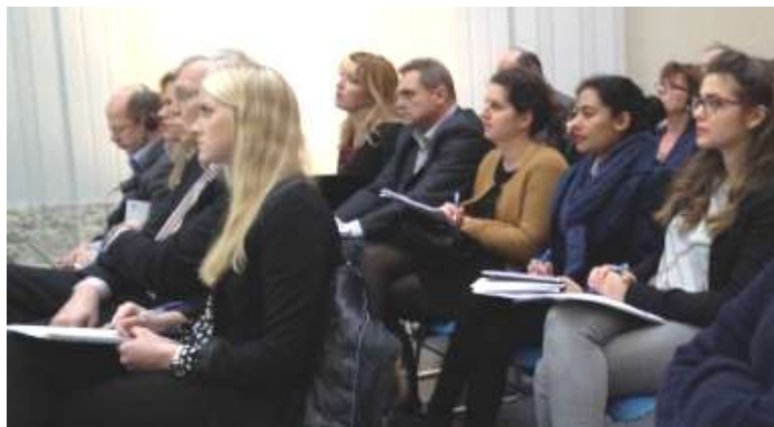
Neki od evropskih predstavnika na Uvodnoj Ino Tool konferenciji u Briselu, 19. Februar 2015.